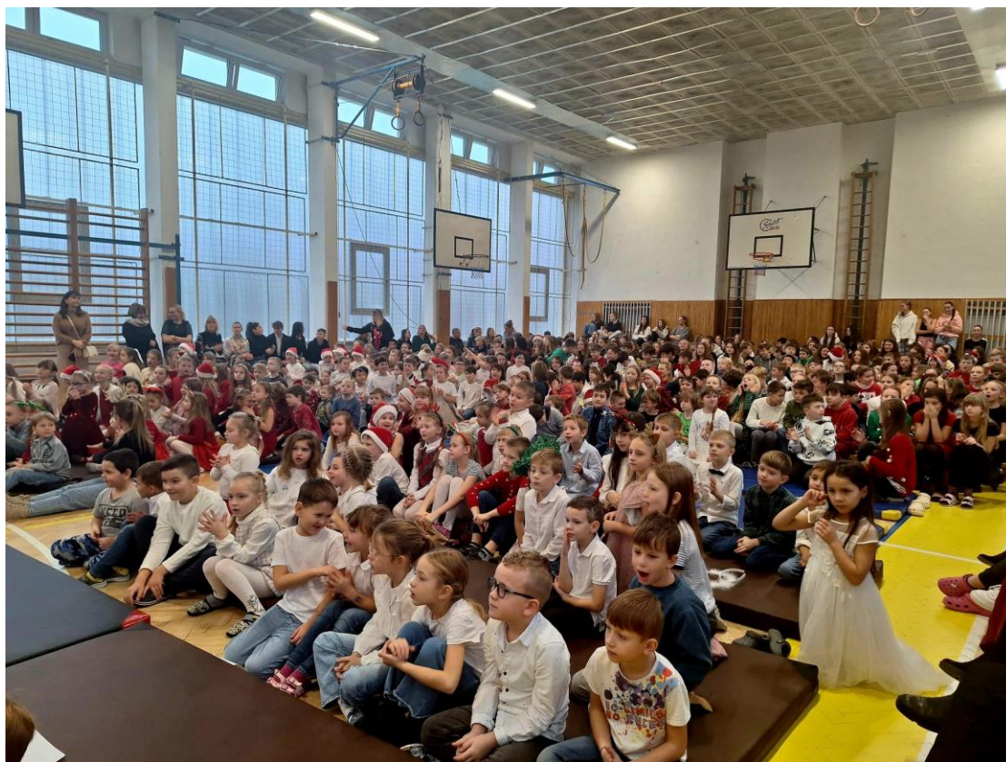
Foto: Vánoční besídka školy

S výše uvedenými změnami byly upraveny také Poznámky k učebnímu plánu a Charakteristika ŠVP (tabulka s volitelnými předměty).