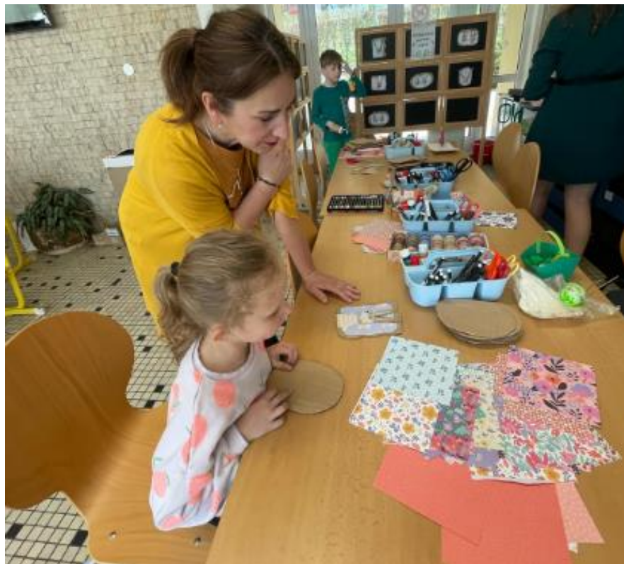
Foto: Velikonoční dílničky pořádané ve spolupráci se SRPŠ