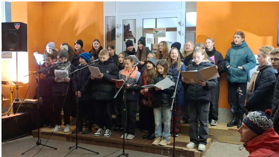
Foto: Adventní setkání a dílničky