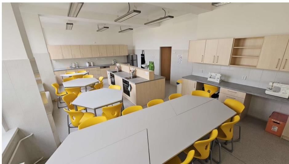
Foto: Modernizace cvičné kuchyňky