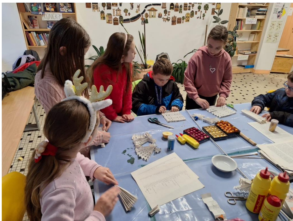
Foto: Adventní setkání a dílničky pořádané ve spolupráci se SRPŠ