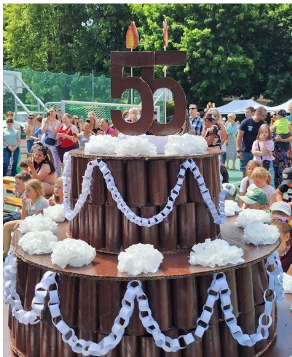
Foto: Oslavy 55. výročí založení školy