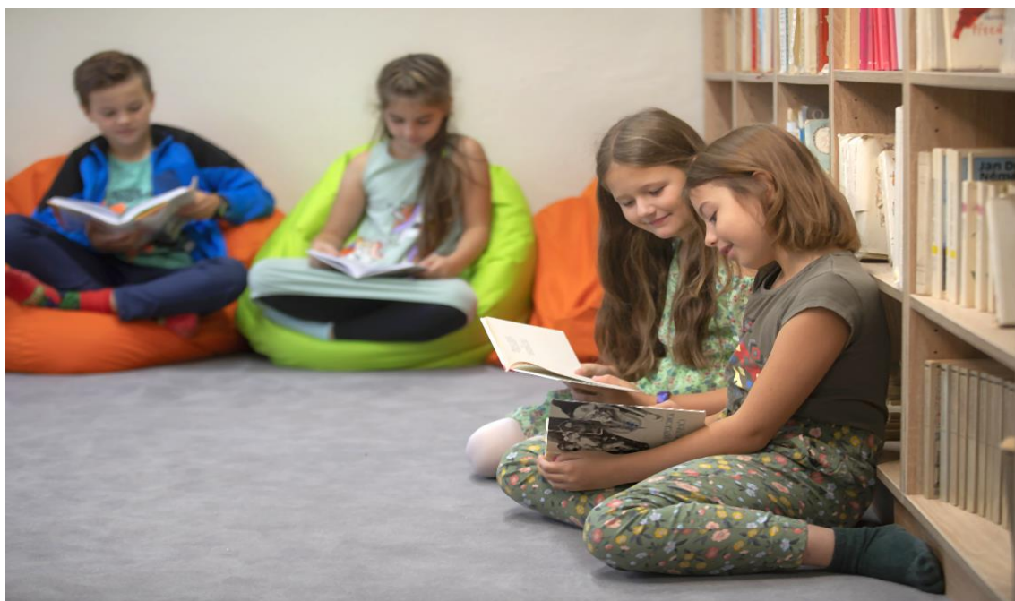
Foto: Relaxační a vzdělávací místnosti naší školy

Běžnou údržbu všech budov školy a celého venkovního areálu včetně hřiště provádí školník s plným úvazkem 1,00. K dispozici je mu formou pronájmu za úplatu školní byt, neboť v objektu v době mimo provoz školy zajišťuje její bezpečnostní dohled. Řídí také práci 7 uklízeček. Přepočtený počet pracovníků úklidu je 5,5. Ve školní jídelně pracuje 6 zaměstnanců včetně vedoucí školní jídelny . Přepočtený počet pracovníků v ŠJ je 7, doplnění stavu kuchařů o 1 pracovníka se stále nedaří. I přesto jídelna denně vaří cca 600 obědů, z toho cca 80 obědů je doplňková činnost (cizí strážníci). Od září 2025 zajišťuje jídelna stravování denního centra Žirafa, z.s., což je denní centrum pro děti s poruchami autistického spektra..