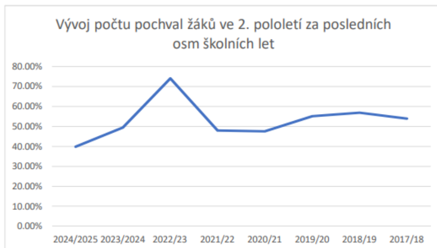
Graf č. 3: Vývoj počtu pochval žáků ve 2. pololetí za posledních osm školních let